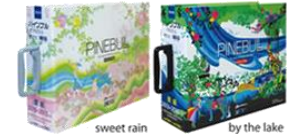
【パインブル】普及品 住宅・店舗向け総合壁紙集 ※表紙2タイプ(収録内容は同じ)