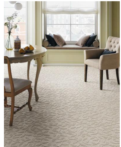
【サンドュエットDU-1】施工例