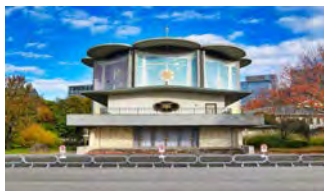
皇后陛下御遷厶記念音楽堂