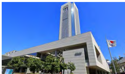
東京オペラシティ