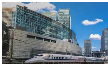
東京国際フォーラム